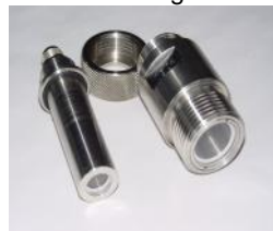
UV-Monitor und Messfenster für zertifizierte Systeme